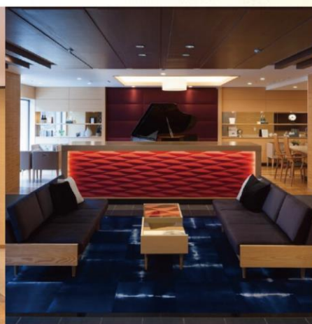
サービス付き高齢者向け住宅 SOMPOケア ラヴィーレレジデンス