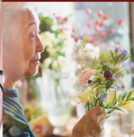
サービス付き高齢者向け住宅 SOMPOケア そんぽの家S