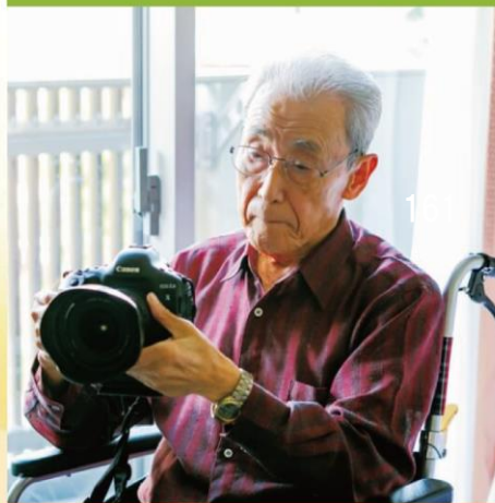
介護付きホーム SOMPOケア そんぽの家