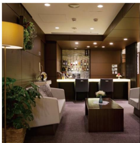
介護付きホーム SOMPOケア ラヴィーレグラン

より自由な暮らしを楽しみたい方も、よりきめ細かなケアをお求めのかたも それぞれが求める暮らし方に、幅広い空間とサービスでお答えします。