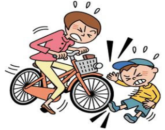
個人賠償責任補償