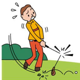
ゴルフ用品の損害