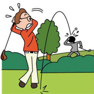
ゴルフ中の 賠償責任