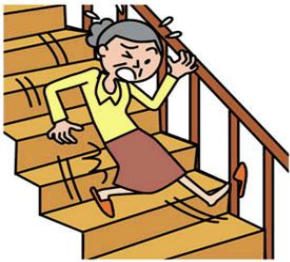
おケガをした時に