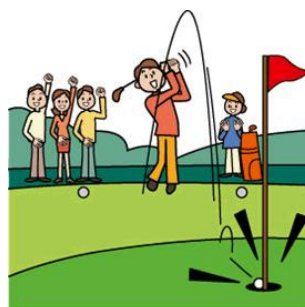
ホールインワン・アル バトロス費用